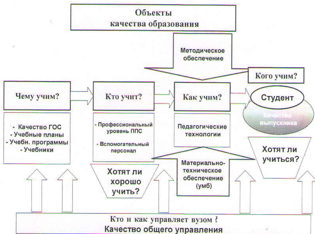
Рис. 2. Объекты качества образования