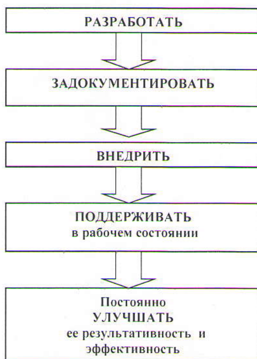
Рис. 3. Алгоритм деятельности Авиаинститута по созданию системы качества

4.6. Критерии представлены набором расчетных показателей, которые при необходимости могут корректироваться, источником расчета являются данные статистики.